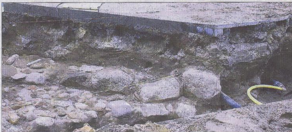
Mittelalterliches Pflaster und Fundamentreste des ehemaligen Stadttors?

Ob irgendwann dann doch eine Ausgrabung am Nordertor durchgeführt wird, hängt dann vor allem davon ab, was den Stadtplanern noch für den Bereich einfällt. Wenn die Gefahr besteht, dass die Fundstelle zerstört werden könnte, muss erst einmal gegraben werden.