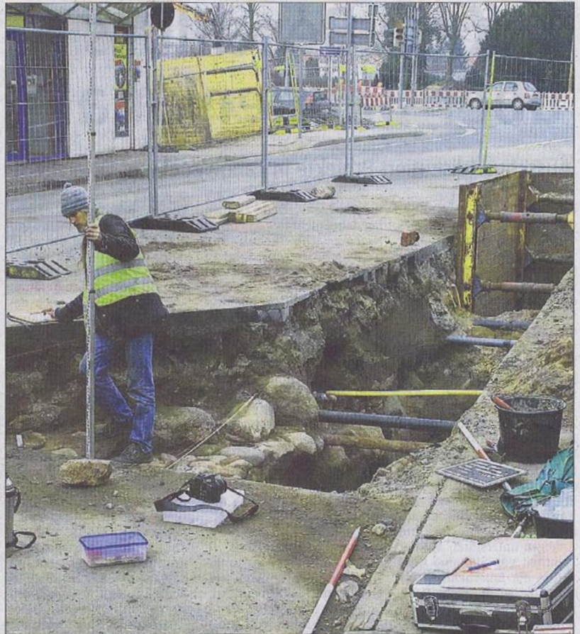
Die Mitarbeiter von Archeofirm haben die Fundstelle vermessen und gesichert.

Noch besser für die Datierung und die Identifizierung des Fundes wäre es natür-